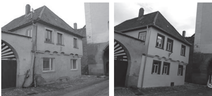
Nur ein Beispiel von vielen für eine gelungene Gebäudesanierung in unserer Altstadt

Nicht zu vergessen: Steuern sparen! Die Abschreibung von bis zu 90% der Sanierungskosten in 10 Jahren vermindert Ihre Lohn- und Einkommensteuer!